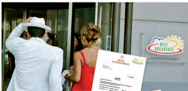
Gütesiegel für Ihre Werbung

Wenn Sie sich als Best Breakfast Gastgeber qualifiziert haben, können Sie unter zwei Verträgen wählen. Sie erhalten die damit vereinbarten Leistungen und sind Best Breakfast Gastgeber!